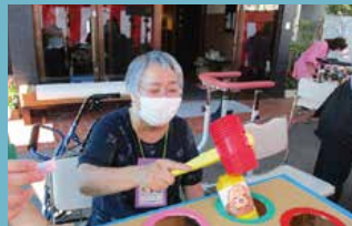
介護付有料老人ホーム フルールハピネスたきかわ