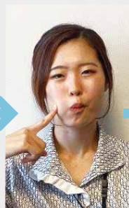
②指を右頬の外側から舌が当たっている所へ当て、舌を押し込むように力を入れます。