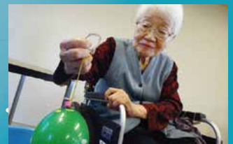
老人保健施設 モエズガーデン小樽