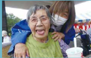
特別養護老人ホーム モエズヴィラ美唄