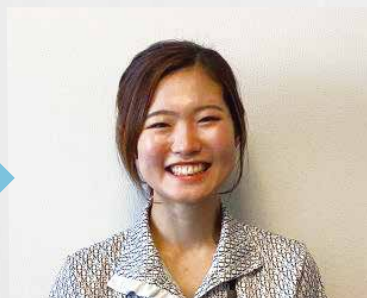
②次に3秒ほど「いー」の口にします。