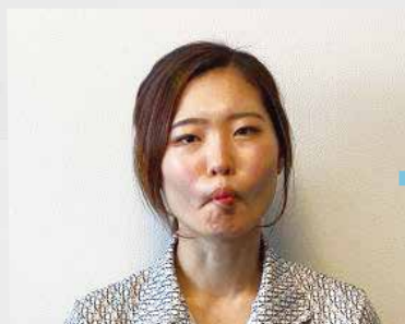
①両頬をすぼめます。