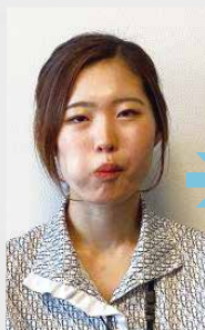
①右頬の内側に舌を動かします。