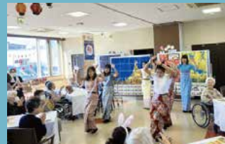
介護付有料老人ホーム フルールハピネスていね