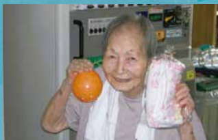
上砂川町立老人保健施設 成寿苑