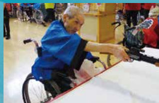
上砂川町立特別養護老人ホーム はるにれ荘