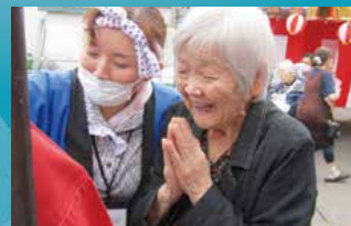
地域密着型特別養護老人ホーム モエズヴィラ東5条