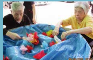
介護付有料老人ホーム フルールハピネスみなと