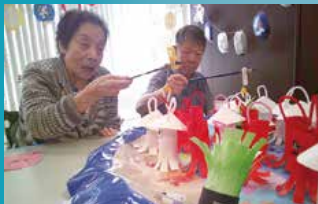
介護付有料老人ホーム フルールハピネスしのろ