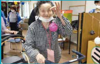
新ひだか町ケアハウス のそみ

今年の夏も企画行事として、各事業所で「ちゃんこい縁日」を開催しました。それぞれの事業所が工夫を凝らし、屋台をイメージしたスペースが屋内外に登場！入居者が昔ながらの射的やヨーヨー釣り、ゲームなどを童心に帰って楽しむ姿がみられました。景品のお菓子やかき氷も大変喜ばれ、縁日は大盛況。北海道の短い夏を満喫いただいたご様子を紹介します。