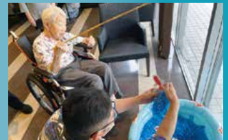
住宅型有料老人ホーム フルールハピネスとまこまい