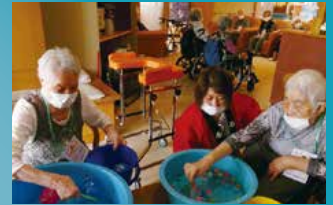
住宅型有料老人ホーム フルールハピネスおびら