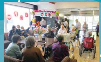
住宅型有料老人ホーム フルールハピネスはこだて