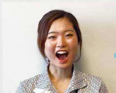
①3秒ほど「あー」の口にします。