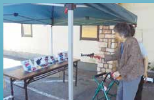
グループホーム はぼ〜れ