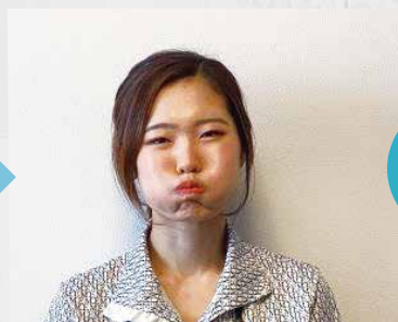
②次に両頬を膨らませます。