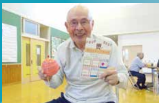
グループホーム エルムの里