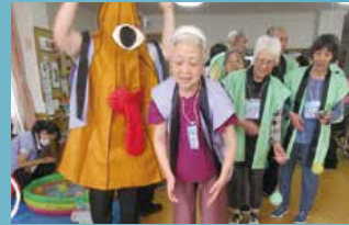
住宅型有料老人ホーム フルールハピネスいしかり