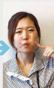
③そのまま3秒程度数えます。