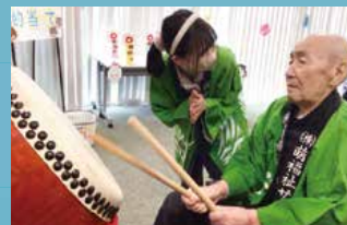
サービス付き高齢者向け賃貸住宅 グランジェMOE篠路