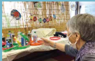
住宅型有料老人ホーム フルールハピネスはぼろ