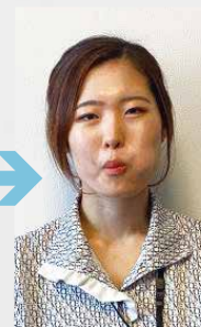
④左側も同じようにやってみましょう。