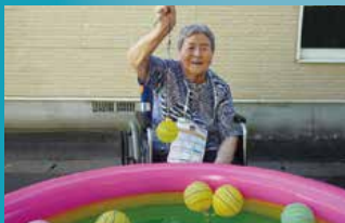
介護付有料老人ホーム フルールハピネスななえ