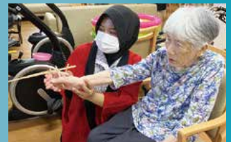
グループホーム 萌 えにわ